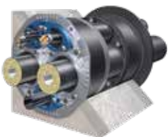
Variante: Quadro-Sicura® Nova 1-FW/breit für Doppel-/Elementwände