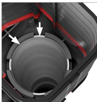
Sichtkontrolle: Oberkante Hülsrohr rastet deutlich sichtbar in Halterung ein (Pfeile)