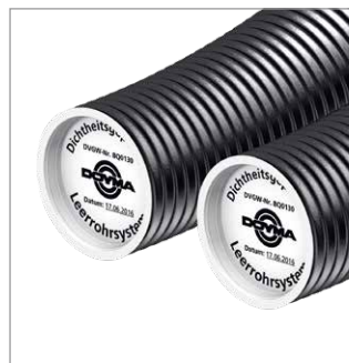
Werkseitig druckgeprüfte Mantelrohre – jetzt DN 90